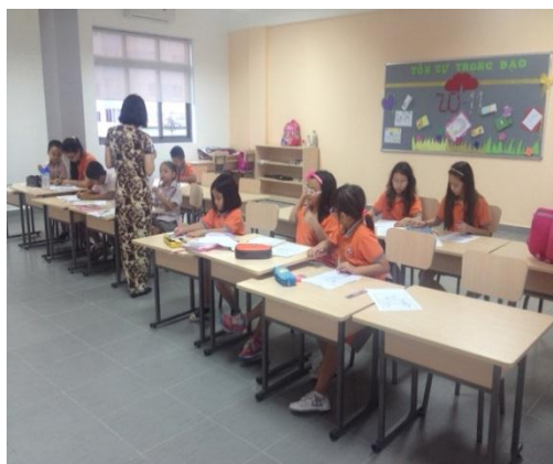
Các em học sinh SVIS trong giờ học Hội Họa