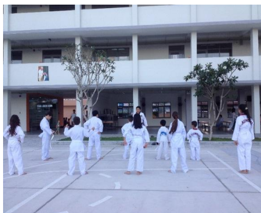
Các em học sinh SVIS trong giờ học Taekwondo