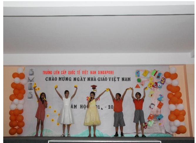
Tiết mục văn nghệ của tập thể các em học sinh Lớp 4