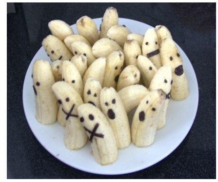
Các món ăn được trang trí theo phong cách Halloween