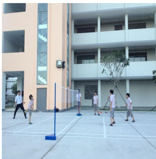
Các em học sinh SVIS tham gia chơi cầu lông sau giờ tan học