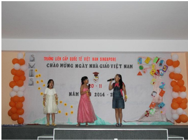
Tiết mục văn nghệ của tập thể các em học sinh Lớp 2 và Lớp 3