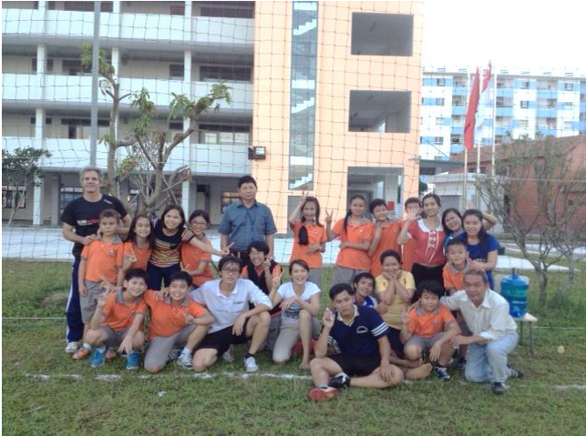
Các em học sinh, giáo viên và nhân viên SVIS tham gia đá bóng chào mừng ngày 20/11