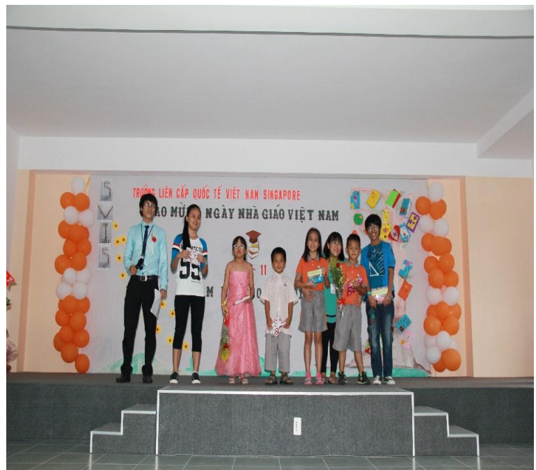
Các em học sinh SVIS lên nhận giải thưởng cá nhân trang trí thiệp chào mừng ngày 20/11