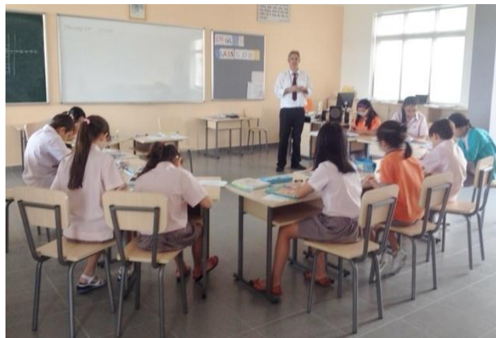
Giờ học của các em học sinh Lớp tiếng Anh