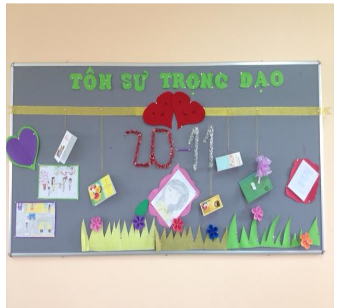
Các em học sinh SVIS tham gia trang trí lớp học chào mừng ngày 20/11