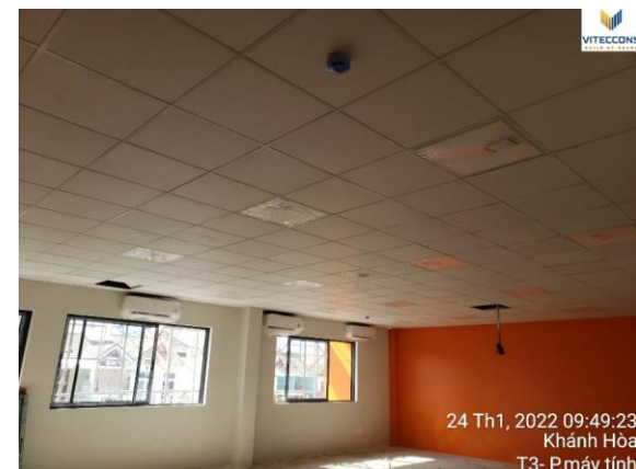
Phòng chức năng