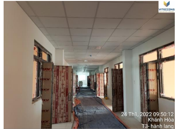
Hành lang tầng 2 và 3