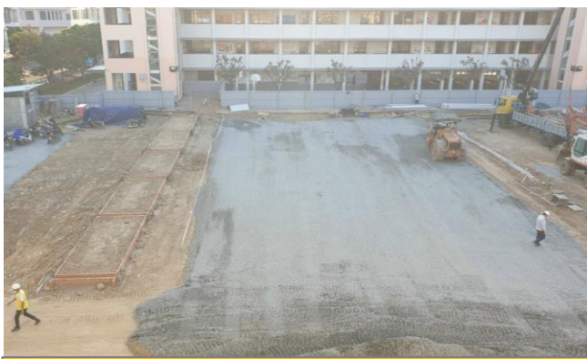
Khu vực bên ngoài: sân bóng đá