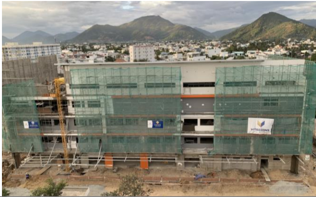
Mặt trước trường